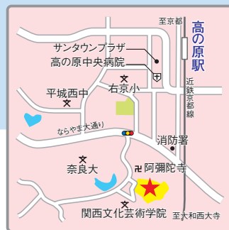
(交通アクセス) 近鉄京都線「高の原駅」より徒歩20分、同駅より「東大寺学園」行きバス6分