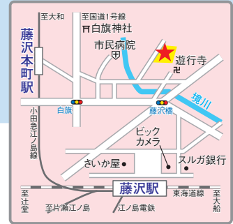
〈交通アクセス〉 JR東海道線「藤沢」駅、小田急江ノ島線「藤沢本町」駅より各徒歩15分