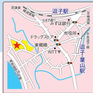
〈交通アクセス〉 JR横須賀線「逗子」駅、京急線「逗子・葉山」駅より徒歩12分