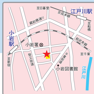
〈交通アクセス〉 JR「小岩」駅より徒歩10分 京成線「江戸川」 駅より徒歩15分