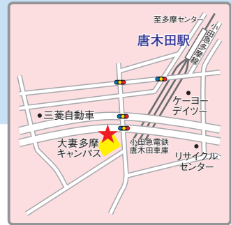
〈交通アクセス〉 小田急線「唐木田」駅より徒歩7分