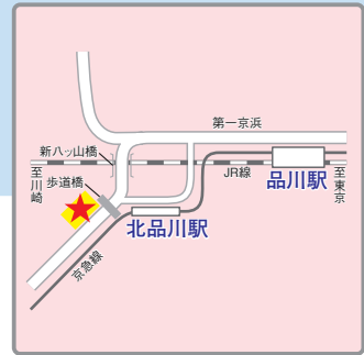
〈交通アクセス〉 京急線「北品川」駅より徒歩2分 JRほか「品川」駅より徒歩12分