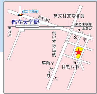
〈交通アクセス〉 東急東横線「都立大学」駅より徒歩8分、JR「目黒」駅よりバス12分「碑文谷警察署前」下車1分