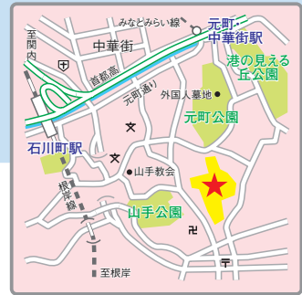
〈交通アクセス〉 JR根岸線「石川町」駅より徒歩13分 みなと みらい線「元町・中華街」駅より徒歩6分