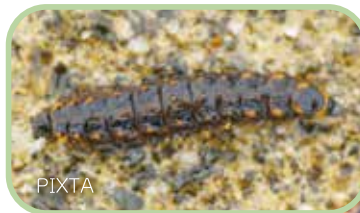
ゲンジボタルの幼虫（左）と、餌のカワニナ（下）